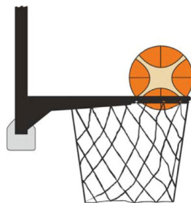
Dijagram 3. Lopta je unutar koša