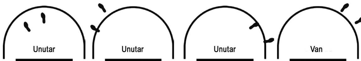
Dijagram 4. Položaj igrača unutar/van polja polukruga bez probijanja

Tumačenje: Pravilna igra igrača A1. Primenjuje se pravilo o polukrugu bez probijanja.