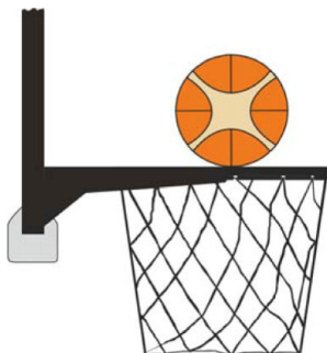
Dijagram 2. Lopta dodiruje obruč